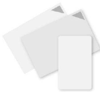
カードリーダー クリーニング用カード